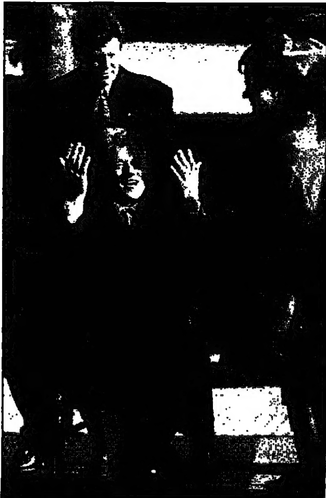
الرئيس الامريكى بيل كلينتون يتلقى على كرسى جملات في مطار هلسنكي عقب وصوله للمشاركة في القمة الامريكية - الروسية.